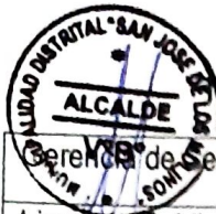
TABLA DE INFRACCIONES Y SANCIONES